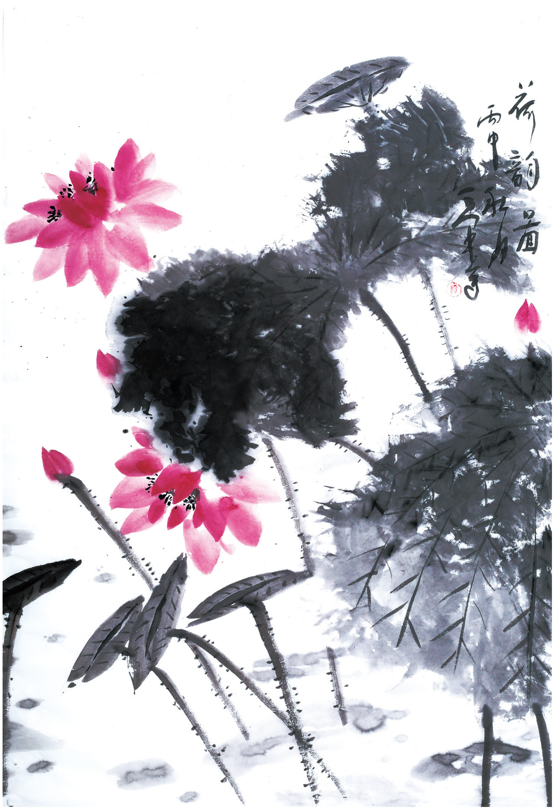
荷韵图 50cm × 75cm