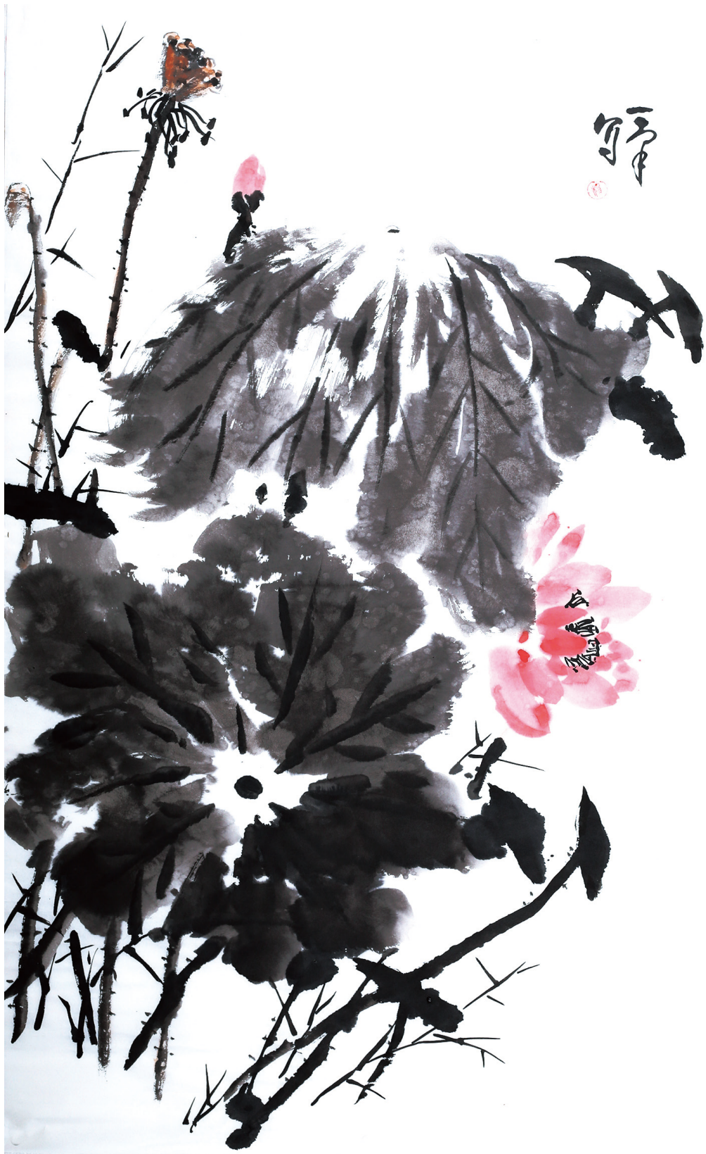
墨荷 50cm × 75cm