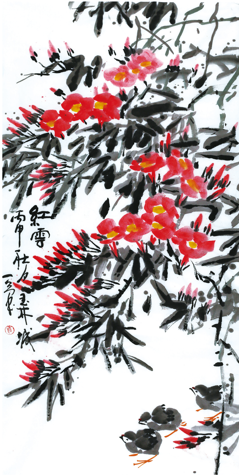
红云 50cm × 100cm